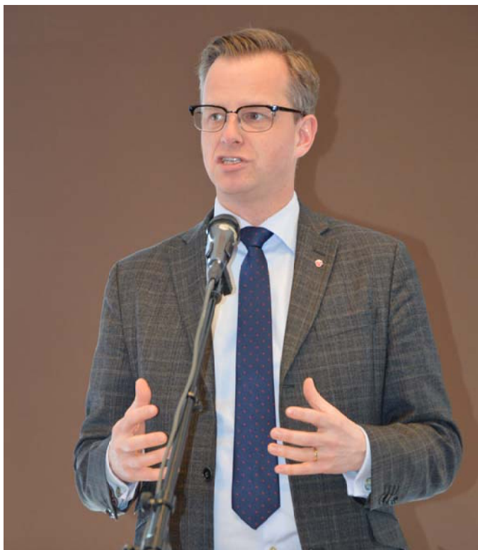
Mikael Damberg inviger årets Framtidsdag

per på arbetsmarknaden inte täcks av försäkringen – när taket blivit så här lågt fyller A-kassan inte längre den rollen. Det är inte bra för någon att ha en så svag A-kassa som vi har idag, det skapar ekonomiska problem i samhället. Inte bara för dem som drabbas av arbetslöshet, det skapar också en ökad otrygghet och en inlåsning på arbetsmarknaden som är farligt för Sverige på sikt, t.ex. kan det vara så att man kanske inte vågar byta jobb.