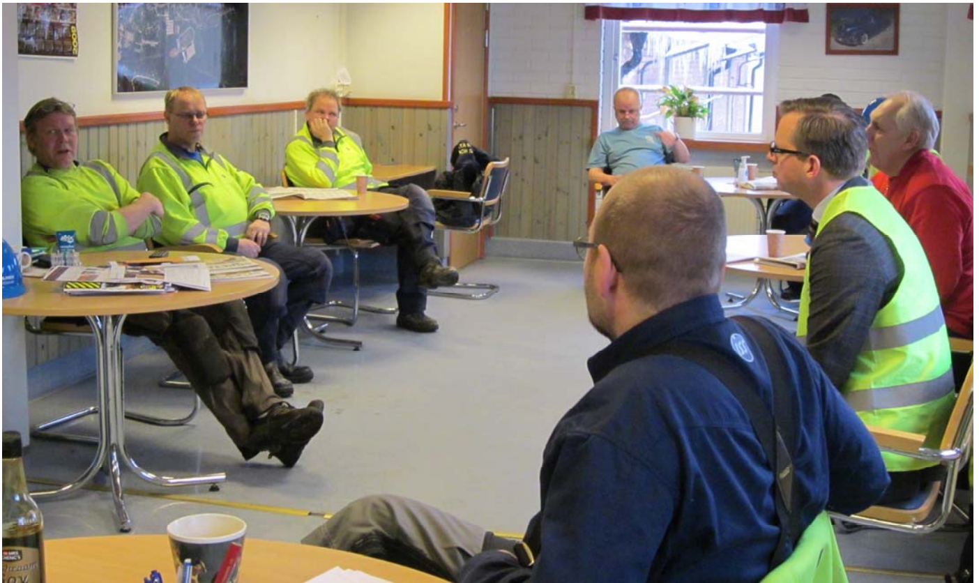
Mikael Damberg i samtalet med Pappers medlemmar på ISS

uppnå det. Om vi tittar på vad den här regeringen har gjort så började de med att helt slå söner Arbetslivsinstitutet och forskningen - som var världsledande runt arbmiljöfrågor! Det som sades var att det bara skulle innebära att univeriteten tar över ansvaret det här. Det vi ser efteråt är att vi tappat jättemycket arblivsforskning i Sverige! Här säger vi att vi måste tillbaka för grunden, för ett bra arbmiljöarbete är att man har kunskap om vad som verkligen fungerar och inte.