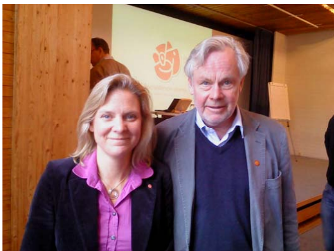
Magdalena Andersson o Peter Persson

P å en konferens i april samlades förbundets fackligt-politiska ansvariga i de olika avdelningarna för att arbeta fram en valplattform för Pappers. Konferensen gästades bland annat av Magdalena Andersson, ekonomisk-politisk talesperson för (s), Jan Larsson, s-valledare samt Peter Persson, Pappers ende riksdagsman.